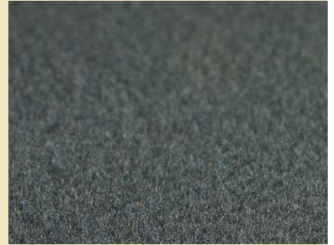
AUTOMOBILVELOURS / AUTOMOTIVE CARPET