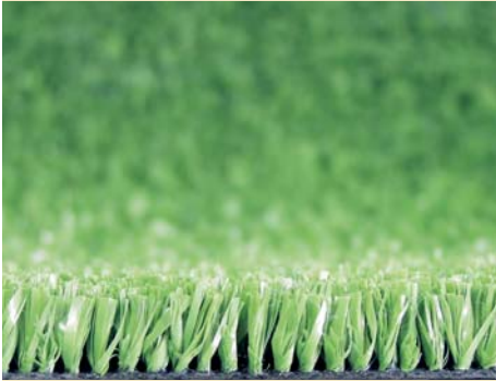
KUNSTRASEN / ARTIFICIAL TURF