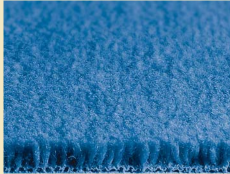
VELOURTEPPICH / CUT PILE CARPET