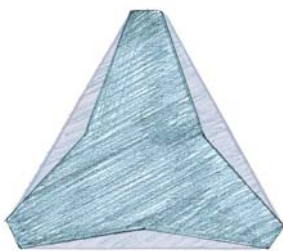
RIDUZIONE DELL'AREA TRIANGOLARE DEL TRI STAR®, COMPARATO AD UNA SEZIONE TRIANGOLARE CONVENZIONALE